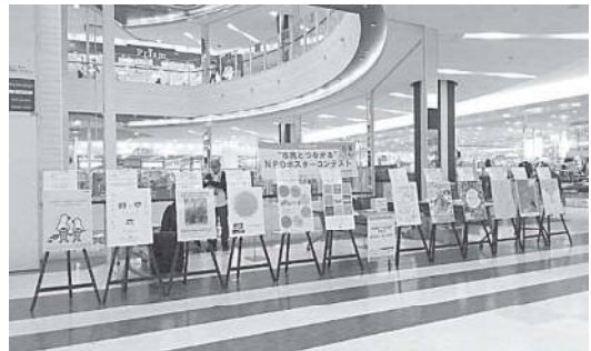
イオンモール新瑞橋での展示・投票(平成30年度)

投票は12月20日(金)開始予定です。エントリー団体や投票方法など、ポスターコンテストの詳細は「なごや★ぼらんぼナビ」のファーストキフ特設ページ、または名古屋市市民活動推進センター公式Facebookを確認ください。