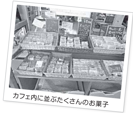
カフェ内に並ぶたくさんのお菓子

併設のカフェには、日替わりのランチメニューや仲間の方たちが作ったプリンやクッキーの販売スペースもあり近隣地域の方々の憩いの場となっています。講座当日も、たくさんのお客さんでにぎわっていました。