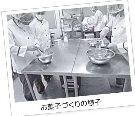
お菓子づくりの様子