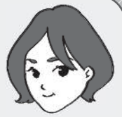
イラスト協力: 加藤舞美

お久しぶりです。ラグビーワールドカップ日本の8強に感動!ご多分に漏れず自信を持っての「にわか」ですが、にわかと呼ばれるのすらちょっとうれしい。毎試合魂が熱くなりました。皆さんはいかがでしたか?そんな中の台風19号。被災地では、ボランティアの受け入れが始まりました。一日も早く日常が戻ることをお祈りいたします。